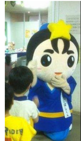
枚方市ゆるキャラ ひこぼしくん

“弥生カレッジCMC”で検索して、TOPページの【講座ガイダンス】 をご参照ください！！