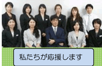
私たちが応援します